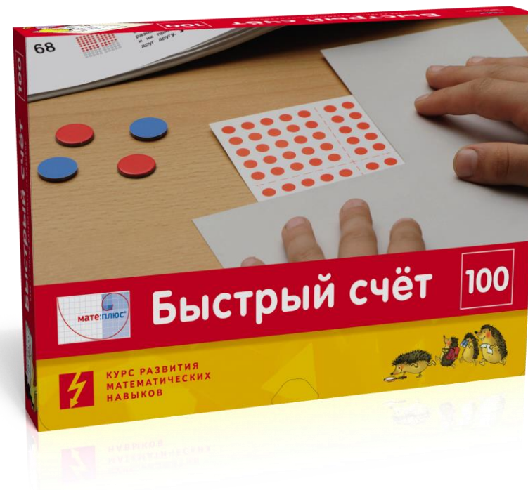
Быстрый счёт в пределах 100