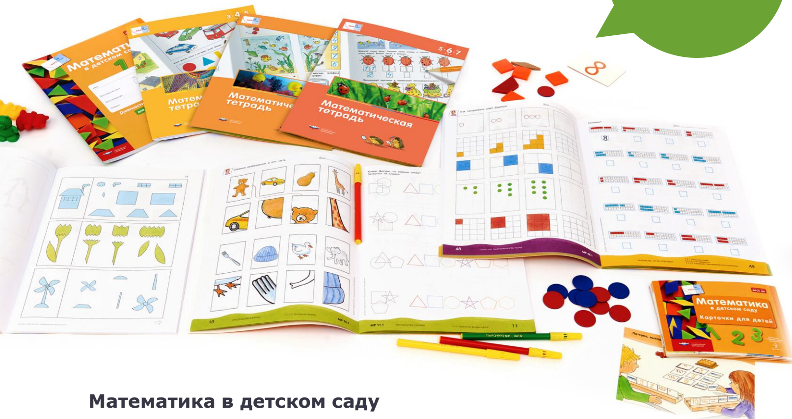
Математика в детском саду